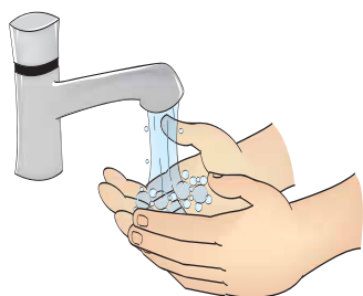
Higienização das mãos